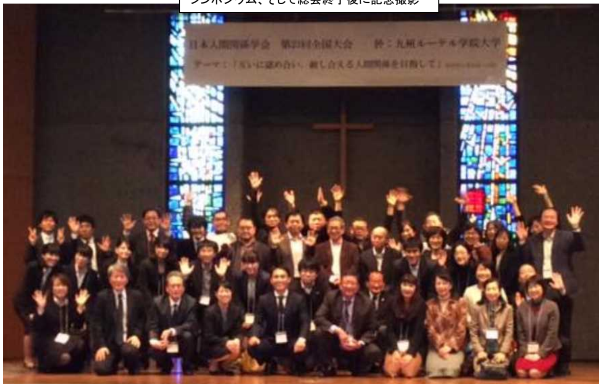
シンポジウム、そして総会終了後に記念撮影