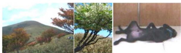
遠足尾根より望む竜ヶ岳 シロヤシオ 昼寝する愛犬ダイアン