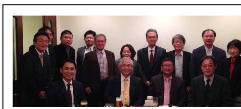
大会前夜の食事会 前代未聞のおもて なし（写真左） 初日の交流会では 学生スタッフ全員 から一言（写真右）

最後に、今大会を無事に終えることができましたのも、実行委員をはじめ会員の皆さまのお力添えの賜と考えております。今後ともよろしく願いいたします。